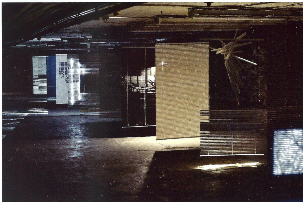
Days in between , 2015. Série de 11 stores vénitien en vinyle. Projections vidéo, feuilles d'or, papier, c-print, tubes argon, lampe halogène, tube fluorescent. Dimensions variables.

Une expérience que Sophie Kitching met littéralement en scène avec l'installation La Nuit de Chateaubriand (2015). L'artiste rejoue « la nuit américaine » de Chateaubriand en matérialisant cette expression employée habituellement dans le domaine cinématographique pour désigner une technique permettant de filmer de jour une scène censée se dérouler de nuit. Prenant la forme d'un piédestal baigné dans une atmosphère bleue, la sculpture s'accompagne de sons, bruissements de feuillages, chutes d'eau enregistrés dans les environs de la maison de Chateaubriand à Châtenay-Malabry, ainsi que d'une boucle sonore, composée en collaboration avec l'organiste Adam Bernadac. Son interprétation à l'orgue vient habiter l'installation et renvoie à une vision presque panthéiste de la nature.