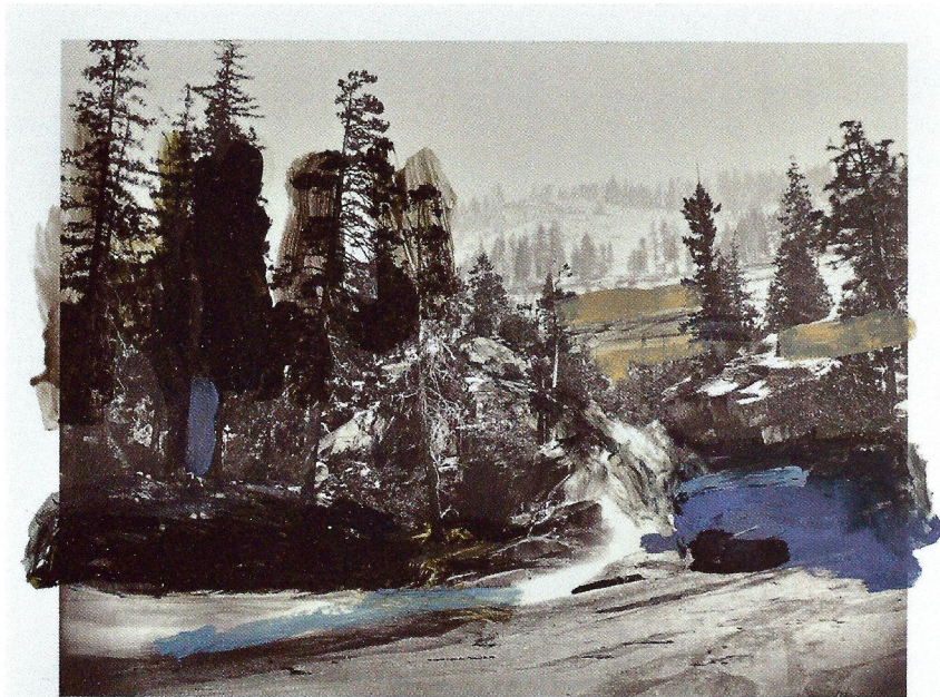
Over Watkins III , 2015 d'après Carleton Watkins, "Cascades between the Vernal and Nevada, Yosemite", 1861. Huile, gouache, graphite, encre sur impression, 28 x 35 cm.

Pour les séries Over Watkins (2015) et Golden Watkins (2016), le travail de Sophie Kitching trouve sa source dans les photographies des paysages immenses et « sublimes » de Yosemite prises par Carleton Watkins au milieu du XIXe siècle. Des paysages qui font écho à ceux parcourus par Chateaubriand à la fin du XVIIIe siècle, alors âgé de 23 ans, et dont il déclinera le souvenir dans ses « nuits américaines ». Ces paysages, bien qu'elle ne les ait jamais traversés, Sophie Kitching en fait l'expérience par sa réappropriation des images de Watkins et du récit de Chateaubriand. En témoigne la série de peintures à l'huile Écritures (2015) réalisées sur des photographies des couvertures intérieures des livres de Chateaubriand dont sont issues les différentes versions des « nuits américaines ».